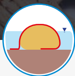
Coraza para protección de estructuras de control hidráulico

Tiene capacidad biaxial y es articulable siendo rígido. Está diseñado para ser utilizado como estructura para paso de vehículos en vías de acceso sobre suelos blandos y para la protección de estructuras de control hidráulico conformadas con tubos geotextil y otras vulnerables a impactos y abrasión.